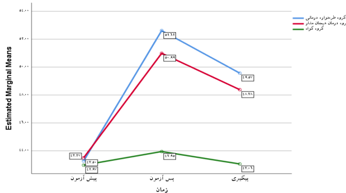
شکل ۲. نمودار تاب‌آوری براساس زمان در گروه‌های طرح‌واره‌درمانی و رویکرد هیجان‌مدار و گواه