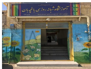
تصاویر ۱ و ۲. ورودی مدرسه دخترانه باغچه‌بان

در هر دو مدرسه صدریه و باغچه‌بان از رمپ استفاده نشده است؛ اما ورودی مجموعه خوانایی لازم را دارد. درخصوص عامل اتصال دیداری/شفافیت، مشاهدات نشان داد که هیچ‌کدام از دو مدرسه دارای درب اتوماتیک و آسانسور نیستند؛ اما در هر دو مدرسه جان‌پناه‌های نرده‌ای شفاف به‌کار رفته است. برای درب‌های ورودی کلاس‌ها نیز تنها