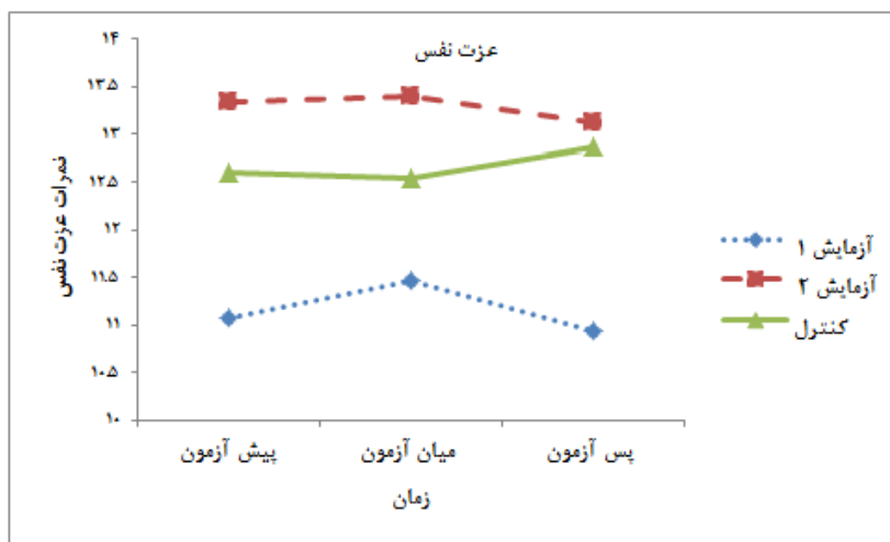
نمودار ۲. عزت‌نفس آزمودنی‌ها به تفکیک سه گروه مطالعه‌شده در مرحله پیش‌آزمون و میان‌آزمون و پس‌آزمون

گروه‌های آزمایش و کنترل وجود ندارد. ( F=0/815 و p=0/450 ): عزت‌نفس