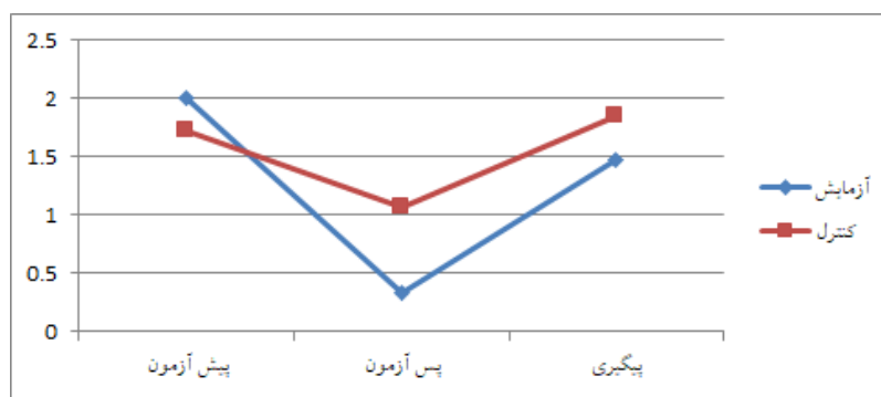
نمودار ۲. مقایسه پیش آزمون و پس آزمون و پیگیری افکار مثبت به مواد در گروه‌های آزمایش و گواه