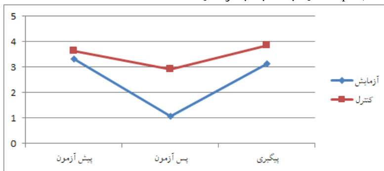
نمودار ۱. مقایسه پیش‌آزمون و پس‌آزمون و پیگیری خودنمایی در گروه‌های آزمایش و گواه

نتایج جدول ۳ نشان می‌دهد که نمرات متغیر خودنمایی در گروه آزمایش و در مرحله پس‌آزمون کمتر از پیش‌آزمون است ( p<۰/۰۰۱ ). نتایج مشخص کرد که خودنمایی در مرحله پیگیری، تفاوت معناداری با مرحله پس‌آزمون دارد ( p<۰/۰۰۱ ). همچنین نتایج نشان داد که نمرات متغیر افکار مثبت به مواد در گروه آزمایش و در مرحله پس‌آزمون کمتر از پیش‌آزمون است ( p<۰/۰۰۱ ). افکار مثبت نسبت به مواد در