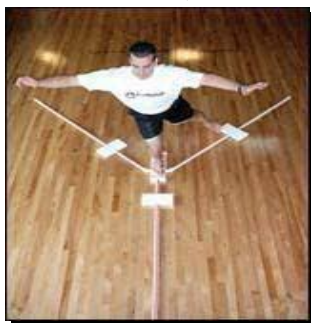
شکل ۱. تست تعادل Y

آزمون را در جهت عقربه‌های ساعت انجام داد. برای اجرای آزمون، آزمودنی با پای برتر در مرکز دستگاه ایستاد و با پای دیگر قسمت متحرک را تا آنجا که خطا نکند، به جلو راند و سپس به حالت طبیعی روی دو پا برگشت. خطاها شامل این بود که پا از مرکز دستگاه حرکت نداشته باشد، روی پایایی که عمل دستیابی را انجام داده تکیه نکند یا آزمودنی نیفتد. فاصله قسمت متحرک تا مرکز دستگاه فاصله دستیابی است. آزمودنی سه بار آزمون را انجام داد و آزمونگر میانگین دستیابی در هریک از جهات را اندازه‌گیری کرد و بر طول پا (برحسب سانتی‌متر) تقسیم و در ۱۰۰ ضرب نمود تا فاصله دستیابی برحسب درصد اندازه طول پا در هریک از سه جهت به دست آید. از جمع اعداد حاصل و تقسیم آن به عدد ۳، امتیاز ترکیبی آزمودنی محاسبه شد (۳۰) (شکل ۱).