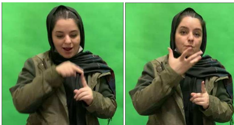
شکل ۱۶. ساخت مالکیت پدر دختر

در بین محرک‌های تصویری این پژوهش، تصویر یک خانواده وجود داشت که اشاره‌گران باید نسبت خویشاوندی افراد را با دختر مشخص شده بیان می‌کردند. بیشتر اشاره‌گران تعریفی از دختر را ارائه نمودند و فضای اشاره‌ای خاصی را به وی اختصاص دادند. آن‌ها نسبت