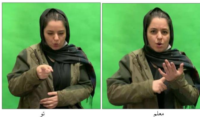
شکل ۱. ساخت مالکیت با مالک ضمیری: معلم تو

مالکیت انتسابی در زبان اشاره ایرانی: در این ساخت، رابطه مالک و مایملک را می‌توان به صورت گروه اسمی بیان کرد و مالک می‌تواند اسم یا ضمیر باشد. یافته‌های پژوهش نشان دادند که در زبان اشاره ایرانی امکان استفاده از ضمائر شخصی منفصل در ساخت‌های اضافی (مانند معلم تو) هست و در این پژوهش هیچ‌گونه مجموعه جداگانه‌ای