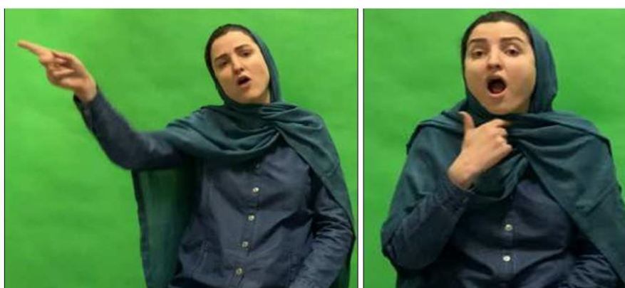
شکل ۳. ساخت مالکیت با مالک ضمیری: فکر آن‌ها (ضمیر آن‌ها در دو حالت نشان داده شد، تفاوتی در تغییر مفهوم و ساخت مشاهده نشد)