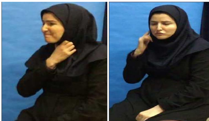
شکل ۱۵. نشان دادن گوش و گلو روی بدن خود اشاره‌گر، بیانگر مفهوم مالکیت، اول شخص: گلولی من (گلولم) یا گوش من (گوشم)

- نشانه‌گذاری فضای اشاره‌ای در ساخت مالکیت: در زبان اشاره ایرانی، سازوکار استفاده از فضای اشاره‌ای در ساخت مالکیت وجود دارد. این موضوع در چند نمونه زیر شرح داده می‌شود. معمولاً اشاره‌گران وقتی می‌خواهند اندام‌های بدن یا وجود دردی را در نقطه‌ای از بدن خود نشان دهند، بعد از اشاره مرتبط (که مایملک محسوب می‌شود) از ضمیر شخصی «من» در مفهوم مالکیت استفاده نمی‌کنند و صرفاً نشان دادن