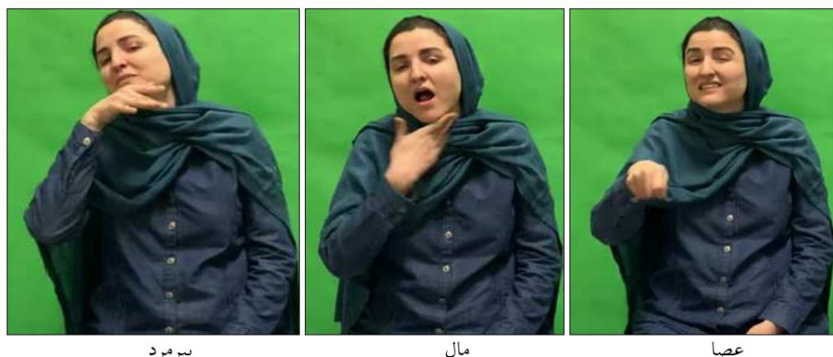
شکل ۱۴. ساخت-تعلق‌داشتن: الف- عصا مال پیرمرد (است).

ساخت خاصی در زبان اشاره ایرانی مشاهده شد که به ساخت «مال کسی بودن» در زبان فارسی شباهت دارد و می‌توان آن را ساخت-تعلق‌داشتن شناسایی کرد. در این ساخت، بعد از اشاره مایملک، چهار انگشت دست راست روی گردن قرار می‌گیرند و سپس به مالک اشاره