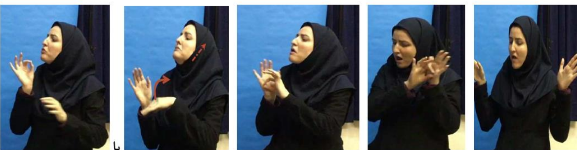
شکل ۱۳. ساخت-داشتن/نداشت: الف- پروانه (روى بال) خال (روى بال) خال دارد/هست. ب- پروانه (روى بال) خال (روى بال) خال ندارد/نیست.

می‌شود. تغییر جایگاه مالک و مایملک در مقایسه با ساخت «داشتن» مشهود است (شکل ۱۴). استفاده از این ساخت برای مالکیت انتقال‌ناپذیر و انتزاعی در داده‌های این پژوهش مشاهده نشد.