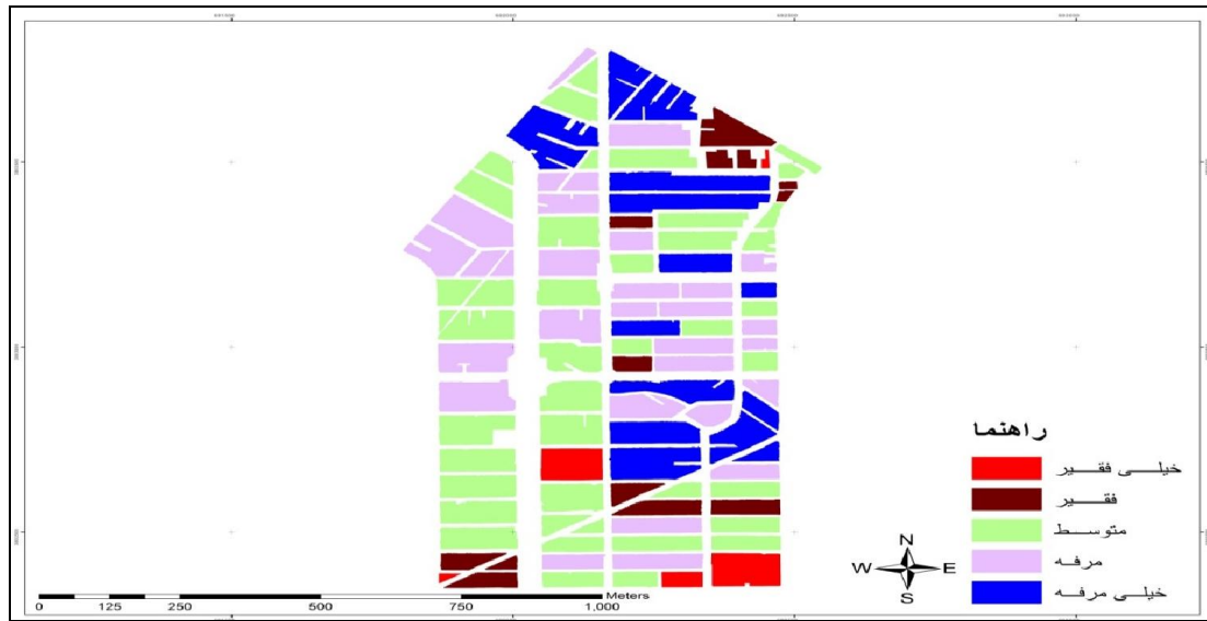
نقشه ۳. پهنه‌بندی فقر در بلوک‌های محله ۲۲ بهمن، با توجه به تلفیق عوامل چهارگانه، در سال ۱۳۸۵