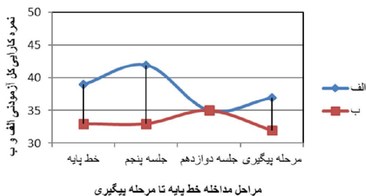
نمودار ۱. مقایسه مراحل مداخله در متغیر نمره کارایی کل آزمودنی «الف» (پسر ۹ ساله) و «ب» (پسر ۱۱ ساله)