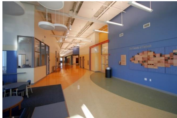
تصویر ۲. استفاده از تغییر رنگ در کف به منظور جهت‌یابی در مرکز اوتیسم (۱۶)