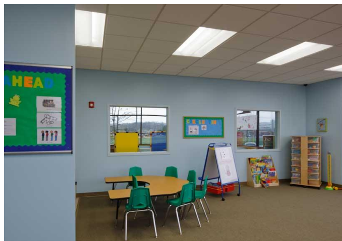
تصویر ۵. کاهش آلودگی صوتی از طریق موقت شدن کف در مرکز اوتیسم (۶)

بیماران روانی مزمن و اختلالات رفتاری اوتیسم ایجاد شد و اولین مرکزی است که همه اهداف آموزشی خود را بر پایه آموزش های کامپیوتری بنا کرد. این مرکز مجهز به بزرگترین سایت کامپیوتری و آموزشی بوده که در جهت اهداف گفتاردرمانی و آموزش های شناختی و افزایش تمرکز و توجه، کمک شایانی به بیماران کرده است. در این مرکز به خدماتی نظیر موسیقی درمانی، دارودرمانی، کاردرمانی و گفتاردرمانی پرداخته می شود.