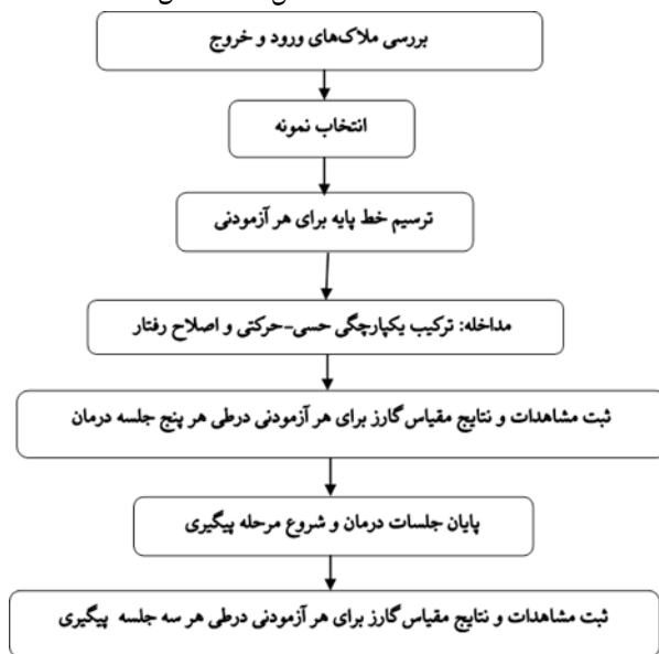
شکل ۱. مراحل و روند اجرای پژوهش

– در تمام مراحل فوق با مشورت مادر، خوراکی محبوب کودک – تقریباً از حدود جلسات پنج و شش به بعد رفتارهای قالبی کاهش مشخص شد و به‌عنوان جایزه در اختیار کودک قرار گرفت. پیدا کرد. مادران آزمودنی‌ها هم گزارش کردند که تعداد دفعات انجام رفتار در خانه هم کمتر شده است. روند جلسات پژوهش حاضر در شکل ۱ مشخص شده است.