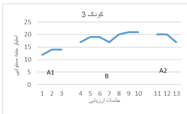
نمودار ۳. تغییرات مربوط به جنبه محتوایی کودک شماره ۳