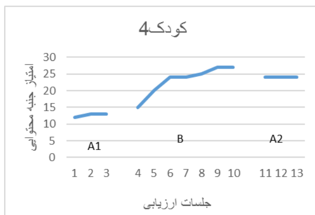
نمودار ۴. تغییرات مربوط به جنبه محتوایی کودک شماره ۴